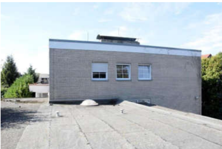
In den großen Kaminen können Dohlen brüten