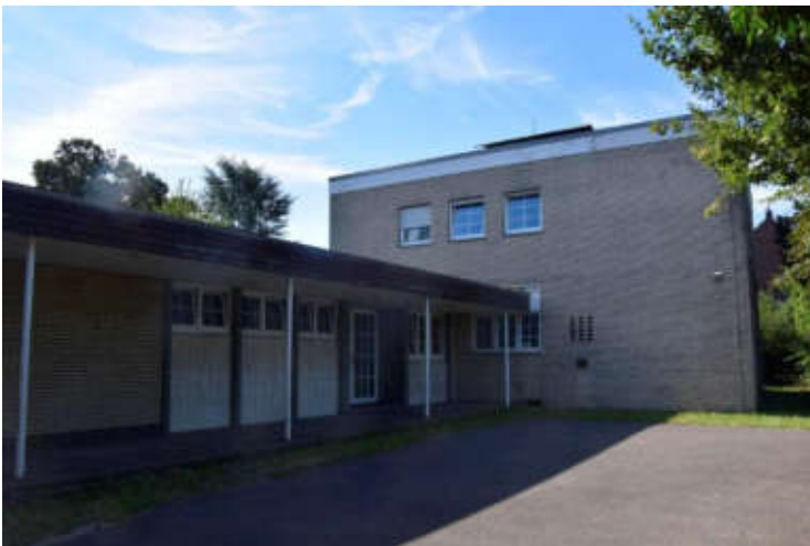
Die Gebäude verfügten über eine umlaufende Attika, Rollladenkästen und tlw. abstehende Teerpappe.