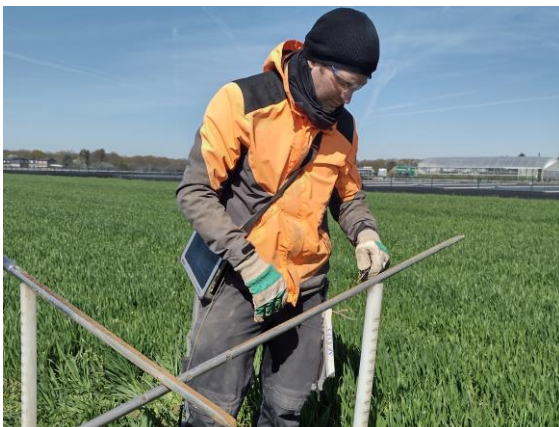
Beurteilung der Bodeneigenschaften durch den Geologischen Dienst

Demnach sind die Beschäftigten und Beauftragten des Geologischen Dienstes NRW berechtigt, Grundstücke – nicht die Gebäude – zu betreten und die notwendigen Arbeiten vorzunehmen. Auf forstliche und landwirtschaftliche Belange und die Nutzung der Grundstücke wird soweit wie möglich Rücksicht genommen. Falls trotzdem durch die Arbeiten Schäden entstehen, werden diese nach den allgemeinen gesetzlichen Bestimmungen ersetzt.