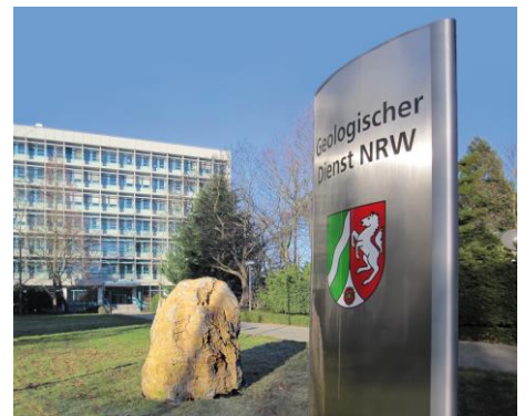
Geologischer Dienst NRW in Krefeld

Im Rahmen der Bodenuntersuchungen führen die Mitarbeiter*innen des Geologischen Dienstes NRW Sondierungen (Handbohrungen) bis maximal 2 m Tiefe durch. Stellenweise werden auch Aufgrabungen angelegt, aus denen Bodenproben entnommen werden.